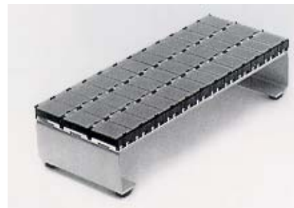
Boites Cms E1

Cadence de pose : de 300 à 600 Composants/H